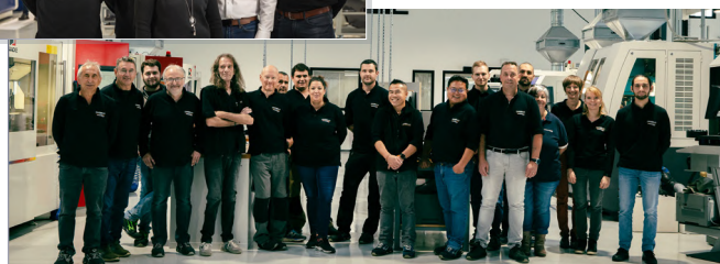
Ci-dessus : Toute l'équipe CARBILLY au cœur du nouveau centre de production de la société à SAINT-PIERRE-EN-FAUCIGNY (74800)