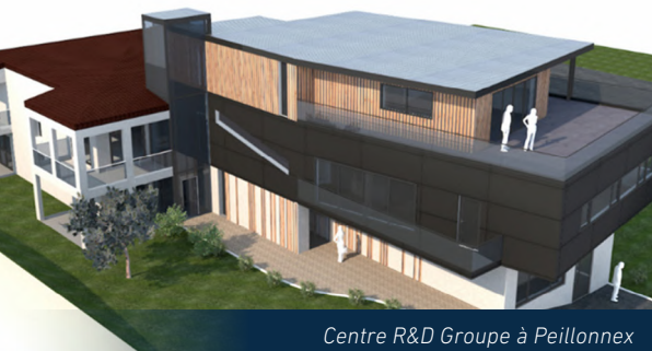
Centre R&D Groupe à Peillonex