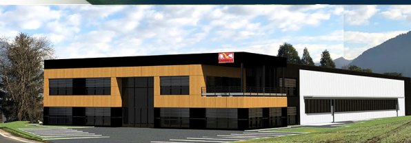
Nouvelle usine Carbilly à Saint-Pierre-En-Faucigny