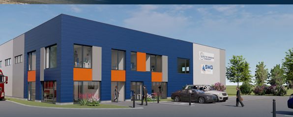
Agrandissement SMG - Electrobroche Concept à Nœux-Les-Mines