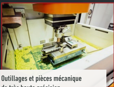
Outillages et pièces mécanique de très haute précision