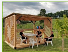
La Qualité de Vie au Travail (QVT) au cœur de nos préoccupations !