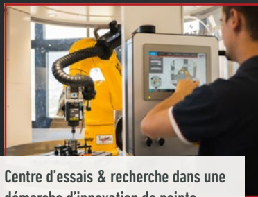
Centre d'essais & recherche dans une démarche d'innovation de pointe

Vous accompagner dans toutes les phases de votre projet d'usinage de précision : voilà la promesse du Groupe PRACARTIS. Bureau d'études et centre d'essais pour l'ingénierie de vos projets, centres de réparation (électrobroches) et de fabrication (outils coupants), distributeur exclusif et intégrateur sur site de votre solution, formations : nos 10 sociétés répondent à l'ensemble de vos besoins pour optimiser durablement vos procédés et stratégies d'usinage.