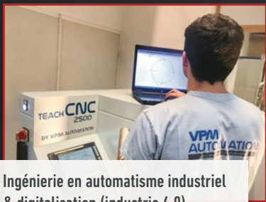
Ingénierie en automatisation industriel & digitalisation (industrie 4.0)