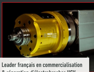
Leader français en commercialisation & réparation d'électrobroches UGV