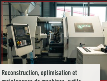
Reconstruction, optimisation et maintenance de machines-outils