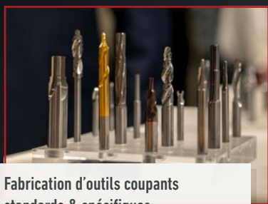
Fabrication d'outils coupants standards & spécifiques