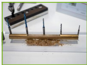
Usinage du laiton sans plomb grâce à des géométries d'outils uniques

Engagé dans une démarche RSE depuis 2019, PRACARTIS a mis au point un plan d'action visant à réduire son empreinte environnementale et à diminuer son bilan carbone . Ces actions visent également à consolider les conditions et la qualité de vie au travail , ainsi que son ancrage local .