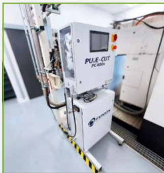
Intégration de l'eco-fluide Supercritique sur tous types de machines outils